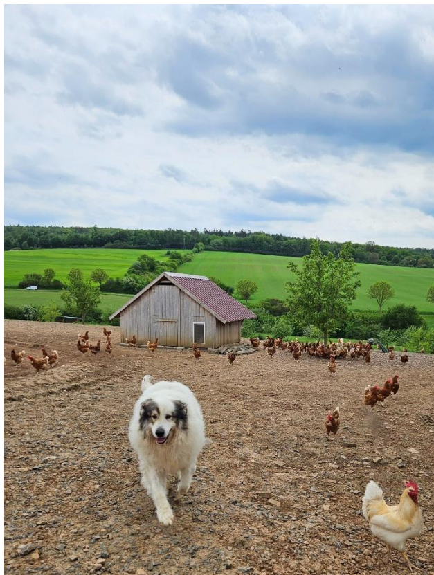
Bewachte Geflügelhaltung auf großen Wiesen.