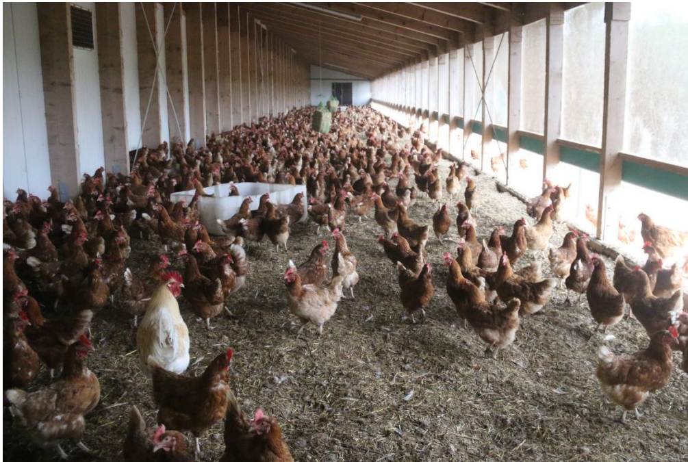
Wettergeschützter Auslauf mit Sandbad: Zwischen Stall und offener Wiese haben die Hühner ausreichend Platz. Eine Reihe Hähne sind auch dabei. Das hält Habichte fern und sorgt für sozialen Frieden.